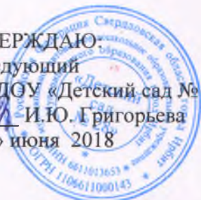
ГРАФИК СМЕННОСТИ СОТРУДНИКОВ